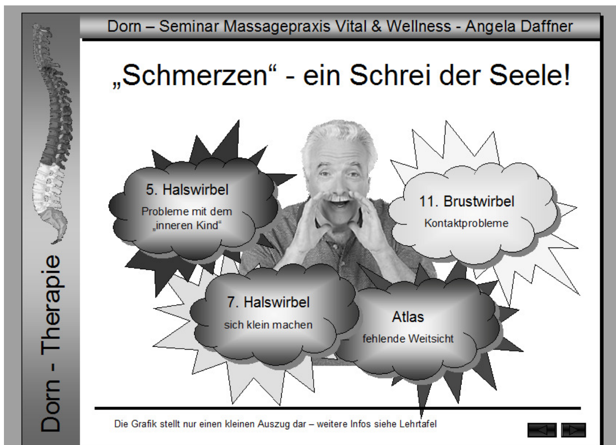
Abbildung 13 Areale, psychisch (Schrei der Seele)

Den Wirbeln sind neben den physischen auch psychische Areale zugeordnet: (Beispiele)